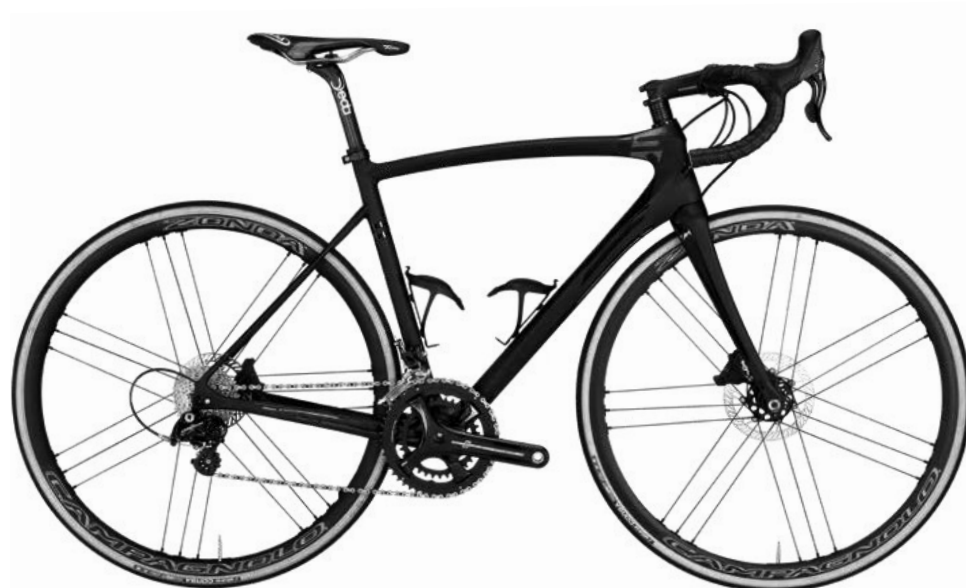
Dieses Rad dient nur zur Darstellung der Farben und Grafiken