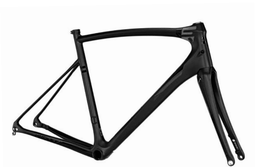
FXD01Ams (Matte - Glossy) Smokey Black - Red - Cool Grey